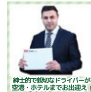
紳士的で親切なドライバーが空港・ホテルまでお出迎え!