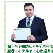
紳士的で親切なドライバーが空港・ホテルまでお出迎え!