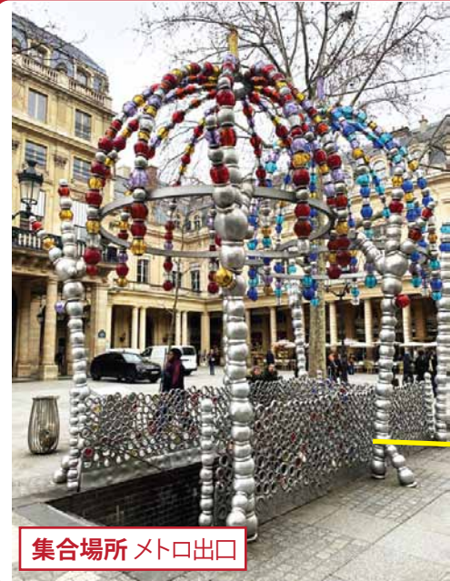
集合場所 メトロ出口